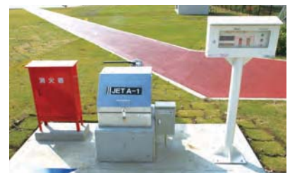
④ タンクローリーエリア