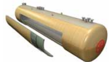
③ 地下タンク(二重殻)