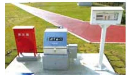
④ タンクローリーエリア