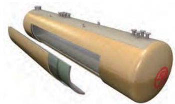
③ 地下タンク(二重殻)